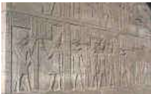
Base do conhecimento