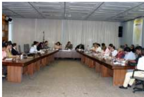
Potencializar o conhecimento